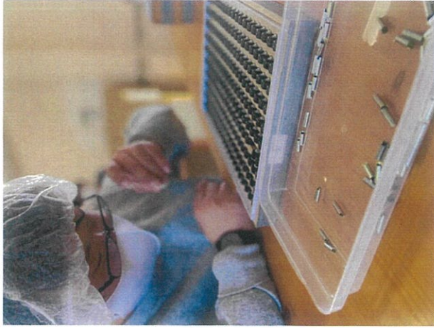
掃除先端部用のローラー。小さな車輪に部品を差し込んでいきます。集中力が求められる作業です。作業に伴って出てくる段ボールや袋の整理→