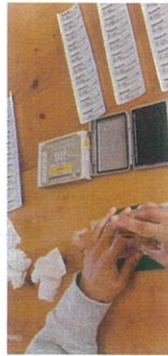
発信機の製品シール、日付や型番を押印する作業は僅かなミスでも認められないので、一回一回が緊張の一瞬です。