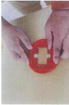
発信機の組み立て。向きを確認しながら組み立てて行きます。