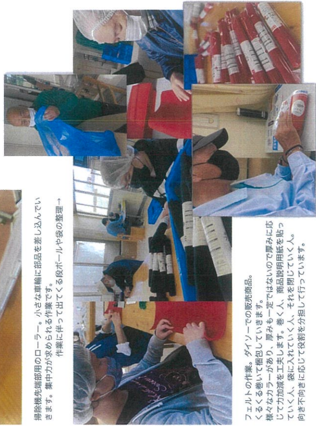
フェルトの作業。ダイソーでの販売商品。くるくる巻いて梱包していきます。様々なカラーがあり、厚みも一定ではないので厚みに応じて力加減を工夫します。巻く人、商品説明用紙を貼っていく人、袋に入れていく人、それを閉じていく人。向き不向きに応じて役割を分担して行っています。